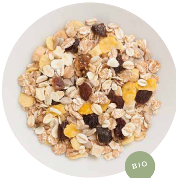
BIO FRÜCHTE MÜSLI