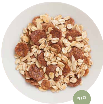
BIO SCHOKO MÜSLI