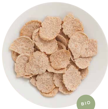
BIO DINKEL FLAKES